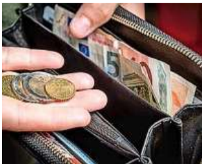
Gezinnen in nood.

Het kabinet besloot eerder de uitstaande schulden kwijt te schelden. De gemeente Heemskerk verwacht volgende week duidelijk te maken hoe ze die gezinnen benadert.