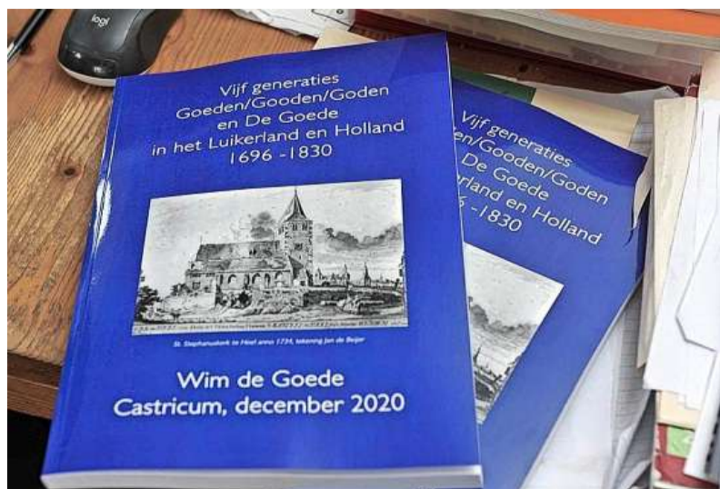
De omslag van het boekwerk.

Het boek 'Vijf generaties Goeden/Goeden/Goden en De Goede in het Luikerland en Holland 1696 - 1830' beschrijft het eerste deel van het onderzoek. Het tweede deel verwacht hij over uiterlijk drie jaar af te ronden. „Ik probeer intussen met familieleden in contact te komen in de hoop dat ze misschien ook materiaal kunnen aanleveren. Oude familiefoto's bijvoorbeeld van rond 1900. Prachtig.”